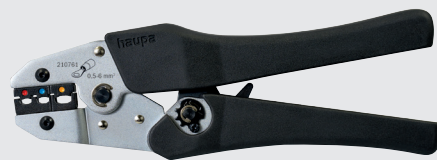
210761 Crimpzange isolierte Kabelschuhe