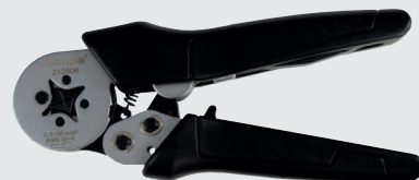
212806 Crimpzange Aderendhülsen 0,5 – 16 mm