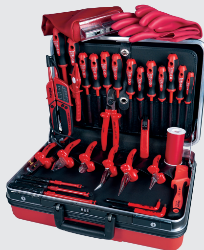
220033 Werkzeugkoffer Venus Plus 1000 V

Hartschalenkoffer, signalrot, komplett mit 32 Sicherheitswerkzeugen Koffer 220032