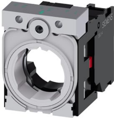
Halter, 3fach, Metall, 1Ö, Schraubanschluss