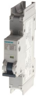
Leitungsschutzschalter 240V 14kA, 1-polig, C, 8A, T=70mm nach UL 489