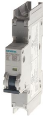
Leitungsschutzschalter 240V 14kA, 1-polig, C, 3A, T=70mm nach UL 489