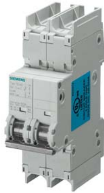
Leitungsschutzschalter 240V 10kA, 2-polig, C, 63A, T=70mm nach UL 489