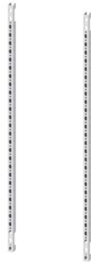
ALPHA 160/400 DIN Längsholme für Montage von Einbausätzen, H=750mm, 1 Satz=2 Holme