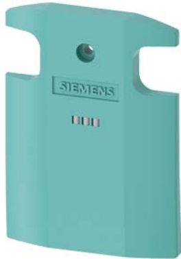
LED-Deckel für Positionsschalter Metall 3SE51 2 LEDs, gelb/grün, DC 24 V Farbe türkis