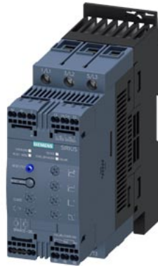
SIRIUS Sanftstarter S2 63 A, 30 kW/400 V, 40 °C AC 200-480 V, AC/DC 24 V Federzugklemmen