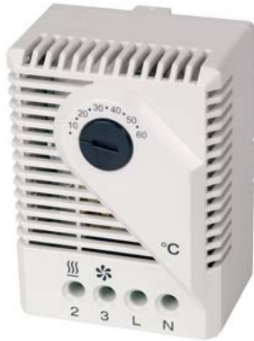
mech.. Thermostat Wechsler 10 bis 60° C