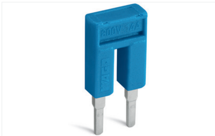
Farbe: ■ blau