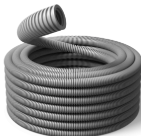
50 mm Speed HF 750N / R25