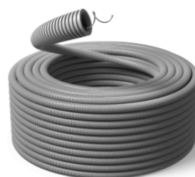
25 mm Speed HF F 750N / R100