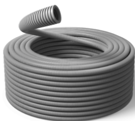
25 mm Speed HF 750N / R100