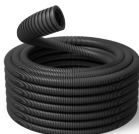
50 mm Speed HF UV 750N / R25