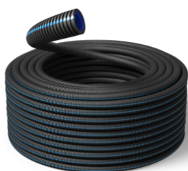
20 mm HiSpeed HF 750N / R100