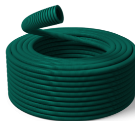
16 mm Speed ECO GREEN 750N / R100