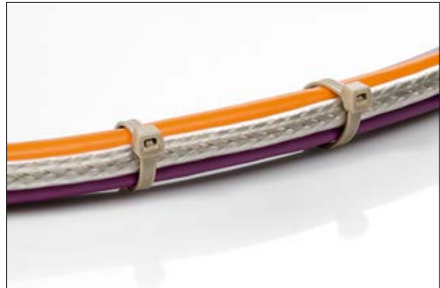
Das Design der außenverzahnten PEEK Kabelbinder ermöglicht ein besonders leichtes Einschlaufen.