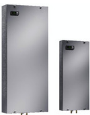
3373100 RTT Luft Wasser Wärmetauscher Wandanbau 2000 W, Basisregelung, 230 V, 50/60 Hz