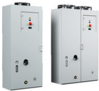
3335960 TopTherm Chiller im VX25 Gehäuse, 20kW