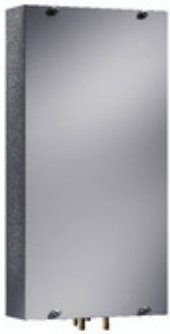
3214100 Luft/Wasser-Wärmetauscher f. Wandanbau 600W