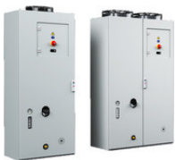
3335970 TopTherm Chiller im VX25 Gehäuse, 25kW