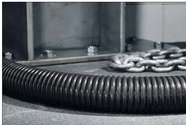
HelaGuard PCS galvanisierter Stahlschutzschlauch, PVC-Mantel.