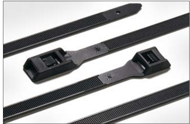
PE- und RPE-Serie mit flacher Kopfgeometrie.