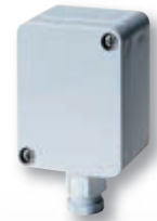
Fühler für Außenmontage Sensor for outdoor mounting