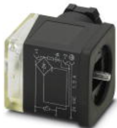
Ventilstecker, 3-polig, Bauform A, 1 LED, mit Schutzbeschaltung: Varistor und Gleichrichter, Schraubanschluss, Kabelverschraubung M16

Bitte beachten Sie, dass die hier angegebenen Daten dem Online-Katalog entnommen sind. Die vollständigen Informationen und Daten entnehmen Sie bitte der Anwenderdokumentation. Es gelten die Allgemeinen Nutzungsbedingungen für Internet-Downloads. ( http://phoenixcontact.de/download )