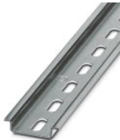
Tragschiene, Material: verzinkt, gelocht, Höhe 7,5 mm, Breite 35 mm, Länge: 2 m

Bitte beachten Sie, dass die hier angegebenen Daten dem Online-Katalog entnommen sind. Die vollständigen Informationen und Daten entnehmen Sie bitte der Anwenderdokumentation. Es gelten die Allgemeinen Nutzungsbedingungen für Internet-Downloads. ( http://phoenixcontact.de/download )