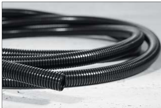
HelaGuard PA6 dünnwandig wird gern in beweglichen Anwendungen eingesetzt.