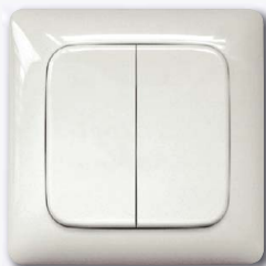
Funktaster mit Doppelwippe (ohne Rahmen)

Funktaster für Rahmen-Innenmaß 55x55 mm mit Radius, 15 mm hoch. Erzeugt die Energie für Funktelegramme selbst bei Tastendruck, daher ohne Anschlussleitung und kein Stand-by-Verlust.