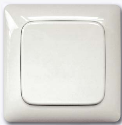
Funktaster mit Wippe (ohne Rahmen)