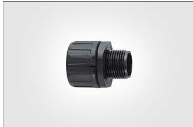
HelaGuard HG-S gerade Verschraubung mit Außengewinde.