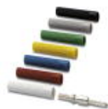
Isolierhülse, Farbe: rot