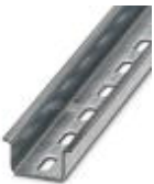
Tragschiene, Material: verzinkt, gelocht, Höhe 15 mm, Breite 35 mm, Länge: 2 m

Tragschiene gelocht - NS 35/15 ZN PERF 2000MM - 1206599