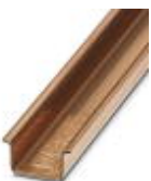
Tragschiene, Material: Kupfer, ungelocht, 1,5 mm dick, Höhe 15 mm, Breite 35 mm, Länge: 2 m

Tragschiene ungelocht - NS 35/15 CU UNPERF 2000MM - 1201895