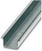
Tragschiene 35 mm (NS 35)

Tragschiene - NS 35/15 WH UNPERF 2000MM - 1204135