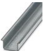
Tragschiene, Material: verzinkt, ungelocht, Höhe 15 mm, Breite 35 mm, Länge: 2 m

Tragschiene ungelocht - NS 35/15 ZN UNPERF 2000MM - 1206586