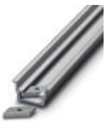
Tragschiene, profil-gezogen, hohe Ausführung, ungelocht 1,5 mm dick, Material: Aluminium, Höhe 15 mm, Breite 35 mm, Länge 2000 mm

Tragschiene ungelocht - NS 35/15 AL UNPERF 2000MM - 1201756