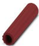
Isolierhülse, Farbe: rot