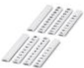
Zackband flach, Streifen, weiß, beschriftet, längs bedruckt: fortlaufende Zahlen 1-10, 11-20 usw. bis 491-500, Montageart: verrasten in flacher Schildchennut, für Klemmenbreite: 5 mm, Schriftfeldgröße: 5,15 x 5,15 mm

Zackband flach - ZBF 5,LGS:FORTL.ZAHLEN - 0808671