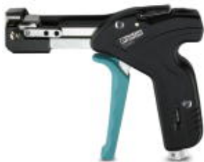
Kabelbinderzange, für Stahlkabelbinder bis 7,9 mm Breite, bis 0,3 mm Materialstärke

Bitte beachten Sie, dass die hier angegebenen Daten dem Online-Katalog entnommen sind. Die vollständigen Informationen und Daten entnehmen Sie bitte der Anwenderdokumentation. Es gelten die Allgemeinen Nutzungsbedingungen für Internet-Downloads. ( http://phoenixcontact.de/download )