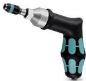
Drehmomentschrauber, Genauigkeit nach EN ISO 6789, einstellbar von 3 - 6 Nm

Bitte beachten Sie, dass die hier angegebenen Daten dem Online-Katalog entnommen sind. Die vollständigen Informationen und Daten entnehmen Sie bitte der Anwenderdokumentation. Es gelten die Allgemeinen Nutzungsbedingungen für Internet-Downloads. ( http://phoenixcontact.de/download )