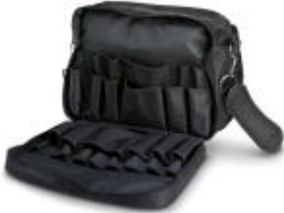
Werkzeugtasche, mit Dokumenten- und Laptopfach, unbestückt

Bitte beachten Sie, dass die hier angegebenen Daten dem Online-Katalog entnommen sind. Die vollständigen Informationen und Daten entnehmen Sie bitte der Anwenderdokumentation. Es gelten die Allgemeinen Nutzungsbedingungen für Internet-Downloads. ( http://phoenixcontact.de/download )