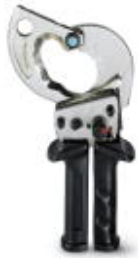
Ringkabelschneider, mit Ratschenfunktion, für Kupfer und Aluminium bis 45 mm Durchmesser (bis 300 mm 2 )

Bitte beachten Sie, dass die hier angegebenen Daten dem Online-Katalog entnommen sind. Die vollständigen Informationen und Daten entnehmen Sie bitte der Anwenderdokumentation. Es gelten die Allgemeinen Nutzungsbedingungen für Internet-Downloads. ( http://phoenixcontact.de/download )