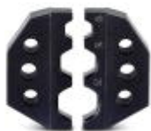
Ersatz-Gesenk für CRIMPFOX-RCT 25-1

Ersatzgesenk - CRIMPFOX-RCT 25-1/DIE - 1212300