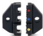
Ersatz-Gesenk für CRIMPFOX-RCI 6

Ersatzgesenk - CRIMPFOX-RCI 6/DIE - 1212058