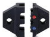
Ersatz-Gesenk für CRIMPFOX-RCI 2,5

Ersatzgesenk - CRIMPFOX-RCI 2,5/DIE - 1212054