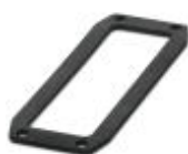
Ersatz-Flachdichtung, für HEAVYCON-EVO-Anbaugehäuse der Bauform B24