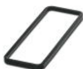
Profildichtung für HEAVYCON-EVO-Unterbaugehäuse der Bauform B24

Profildichtung - HC-B24-SP-RBK - 1407709