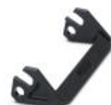
Ersatzlängsbügel für HEAVYCON-EVO-Gehäuse der Bauform B24, PA