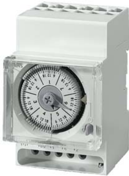
QUARZ-SCHALTUHR TAG 1WECHSLER 230V/50-60HZ 3TE