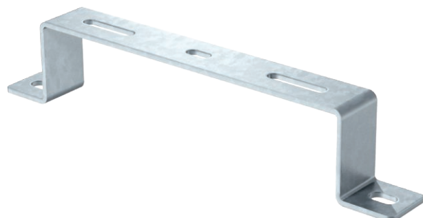
Distanzbügel für Kabel- und Gitterrinnen.