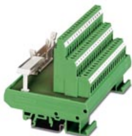
VARIOFACE-Modul, zur Montage auf NS 35/7,5 oder NS 32, zum Anschluss von 16 Näherungsschaltern

Bitte beachten Sie, dass die hier angegebenen Daten dem Online-Katalog entnommen sind. Die vollständigen Informationen und Daten entnehmen Sie bitte der Anwenderdokumentation. Es gelten die Allgemeinen Nutzungsbedingungen für Internet-Downloads. ( http://phoenixcontact.de/download )