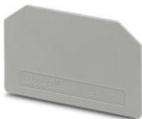
Abschlussdeckel, Länge: 46 mm, Breite: 1 mm, Höhe: 28,7 mm, Farbe: grau

Bitte beachten Sie, dass die hier angegebenen Daten dem Online-Katalog entnommen sind. Die vollständigen Informationen und Daten entnehmen Sie bitte der Anwenderdokumentation. Es gelten die Allgemeinen Nutzungsbedingungen für Internet-Downloads. ( http://phoenixcontact.de/download )