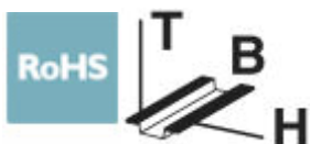
Abbildung zeigt die Variante UM 45-D37SUB/S

VARIOFACE-Modul, mit Schraubanschluss und D-Subminiatur-Buchsenleiste, zur Montage auf NS 35/7,5, Polzahl 25