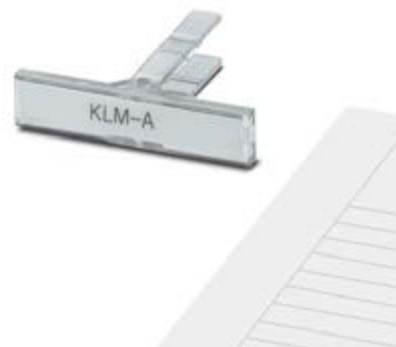
Abbildung zeigt eine Kombination aus den Varianten KLM-A, und ESL 44 x 7

http://eshop.phoenixcontact.at/phoenix/treeViewClick.do?UID=0809421