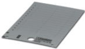
Abbildung zeigt Variante des Artikels

Kunststoffschild, Karte, silber, unbeschriftet, beschriftbar mit: THERMOMARK CARD, Montageart: Kleben, Schriftfeldgröße: 27 x 12,5 mm