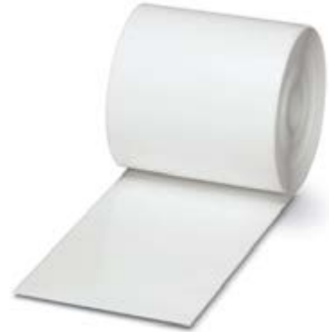
Bild zeigt Variante in weiß

http://eshop.phoenixcontact.at/phoenix/treeViewClick.do?UID=0800552