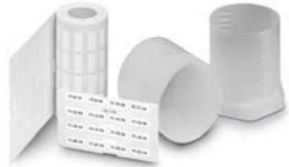
Abbildung zeigt die Produktvariante EML (20X8)R

http://eshop.phoenixcontact.at/phoenix/treeViewClick.do?UID=0816184