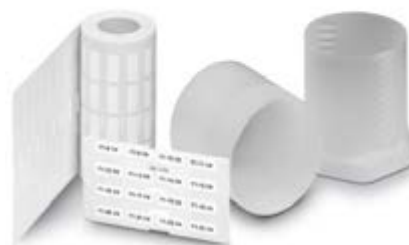
Abbildung zeigt die Produktvariante EML (20X8)R

http://eshop.phoenixcontact.at/phoenix/treeViewClick.do?UID=0816922