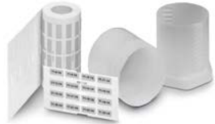
Abbildung zeigt die Produktvariante EML (15X9)R SR

http://eshop.phoenixcontact.at/phoenix/treeViewClick.do?UID=0816854