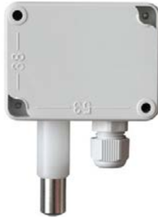
Abb. 2 Rückansicht mit Bemaßung der Öffnungen für die Befestigung