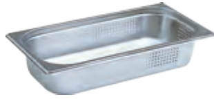
Dampfgarbehälter gelocht DGGL 5