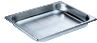
Dampfgarbehälter gelocht DGGL 8