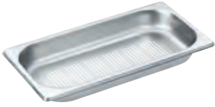
Dampfgarbehälter gelocht DGGL 1

Zum Blanchieren oder Garen von Gemüse, Fisch, Fleisch, Kartoffeln u.v.a.m.