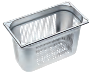
Dampfgarbehälter gelocht DGGL 19