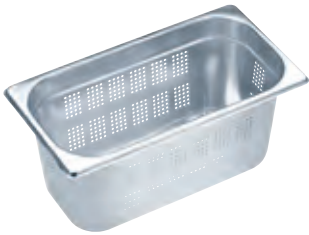
Dampfgarbehälter gelocht DGGL 10