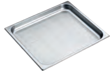
Dampfgarbehälter gelocht DGGL 12