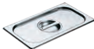
Edelstahl-Deckel mit Griff DGD 1/3