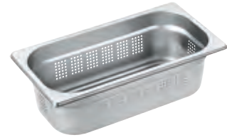
Dampfgarbehälter gelocht DGGL 6