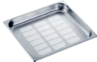
Dampfgarbehälter gelocht DGGL 13