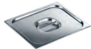
Edelstahl-Deckel mit Griff DGD 1/2