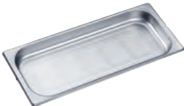
Dampfgarbehälter gelocht DGGL 20