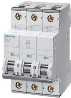
Leitungsschutzschalter 400V 6kA, 3-polig, C, 16A, T=70mm